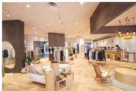
店内中央部分には、ヴィンテージのソファやベッドなどを置き、買い物をしながらくつろげる居心地の良い空間を提供

2021年4月、「STYLEMIXER」は大型旗艦店をららぽーとTOKYO-BAYにオープンしました。店内は既存店同様リラックスして過ごせる空間をイメージしており、店内中央部分にはライフスタイルと寄り添うシーンを想像できるヴィンテージのソファやベッドなどを置き、お買い物しながらくつろげる居心地の良い空間を提供しています。陶芸家の竹村良訓氏の作品や海外よりセレクトした雑貨アイテムも展開。なお、地球環境保全の一環として無料ショッパーや雨カバーを廃止し、エコバッグを購入していただくシステムを導入しています。