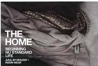
ルームウェアライン「THE HOME」