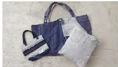
デニムをアップサイクル リメイクアイテム

2021年3月、「AZUL BY MOUSSY」はみなとみらい東急スクエア 1Fに首都圏最大規模となる体験型の新店舗をオープンしました。約140坪の広さに、ブランドが掲げる「Space」「Sound」「Fragrance」「Culture」「Person」「Black」といった要素が詰まった「RADICAL STORE」は、これらすべてのコンテンツを体感できる全国で唯一の空間です。また限定のコンテンツとして、ブランドのシグネチャーカラーである黒を基調としたアイテムを集約し、季節ごとに展開する商品テーマを決めて陳列する特設コーナー「THE BLACK ONE」を設置。サステナブルもテーマとし、「AZUL BY MOUSSY」の再生素材を用いた商品に加え、新たにリメイクしたアップサイクル商品の展開や、店内装飾に廃材を活用するなど環境に配慮した取り組みも行われています。