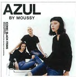
AZUL BY MOUSSY [アズールバイマウジー]