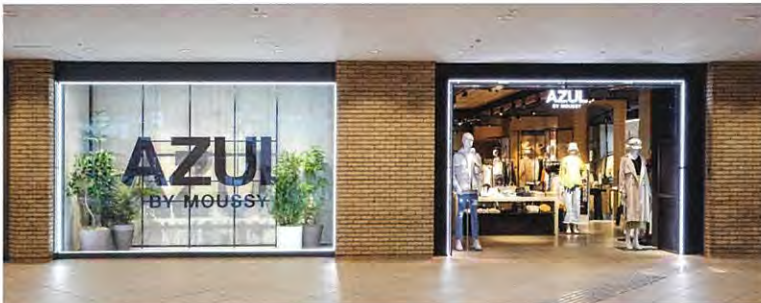
店舗内装にも再生素材を使用