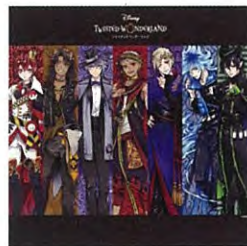
R4G [アールフォージー]