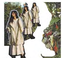
BLACK BY MOUSSY [ブラックバイマウジー]