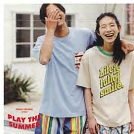
RODEO CROWNS WIDE BOWL [ロデオクラウンズワイドボウル]