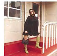
LAGUA GEM [ラグア ジェム]