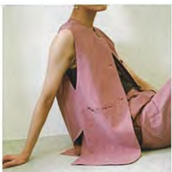
s/m STYLE MIXER [スタイルミキサー]