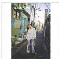
HeRIN.CYE [ヘリン ドット サイ]