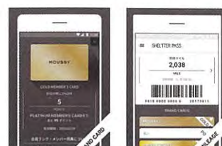
SHEL'TTER PASS [シェルターパス]