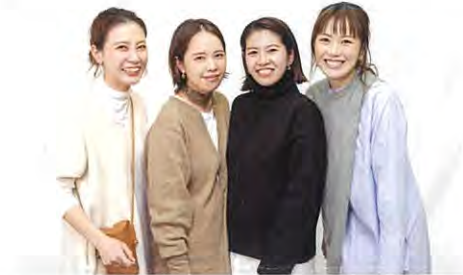
Eコンテンツ開発部のママ社員たち

ママ・パパ世代の働きやすさを考慮し、昨年新設部署として立ち上がったEコンテンツ開発部は、子育てを軸にサポートしあえる雰囲気を生かした相互理解のある職場環境が仕事へのモチベーションを高め、結果主義の部署に。時短勤務でありながらも、スタッフ同士でルールづくりや役割分担を行い、目標に向かい生き生きと仕事をしています。